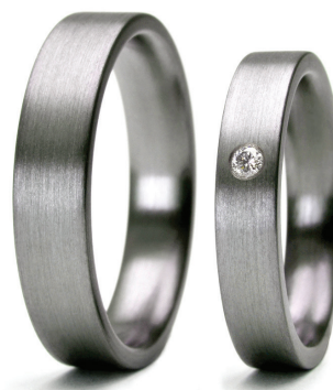
Pure Flat : Alliances en tantale brossé Pure Flat 5 mm et 4 mm avec diamant 0,033 ct G/SI. Tantale pur (Ta999)