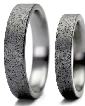
Pure Flat Moon : Alliances en tantale satiné Pure Flat Moon 4 mm et 5 mm. Tantale pur (Ta999)