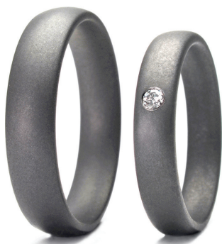
Pure Curve Dark : Alliances en tantale sablé Pure Curve Dark 5 mm et 4 mm avec diamant 0,033 ct G/SI. Tantale pur (Ta999)