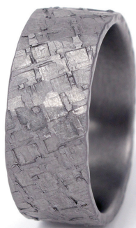
Surface Damier 8 MM : Alliances en tantale sablé Pure Curve Dark 5 mm et 4 mm avec diamant 0,033 ct G/SI. Tantale pur (Ta999)

Ainsi, ce métal noble, sombre dans la masse, trouve son plus bel écho dans les deux collections que propose L'Atelier du Tantale. Dans la tradition des alliances, la « collection Pure » existe dans une large gamme de tailles et de largeurs (de 45 à 77 et de 2 mm à 12,5 mm). La souplesse de personnalisation est telle que toutes les épaisseurs, tailles et finitions sont possibles. Il en est de même pour la collection homme « Surface » qui propose des bagues texturées et très prochainement, des chevalières. Avec plus de 200 références dont le prix moyen se situe aux alentours de 600 euros prix public conseillé, les collections de L'Atelier du Tantale ont de quoi séduire les détaillants souhaitant se démarquer avec un produit audacieux. « Mon objectif pour 2023 est d'être présent dans une cinquantaine de points de vente moyen et haut de gamme avec nos différentes collections et les présentoirs en chêne brut qui rappellent l'aspect minimaliste du tantale » précise Frédéric Manin qui fourmille d'idées pour ce métal qui n'a pas fini de faire parler de lui.