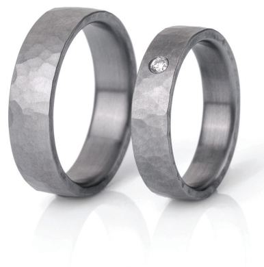
Surface Martelée : Bagues en tantale texturé SURFACE Martelée 5 et 6 mm. Tantale pur (Ta999)